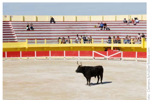
Die Subventionen für den Stierkampf gehören hoffentlich bald der Vergangenheit an.

Ich habe im vergangenen Jahr viele Petitionen für Tierschutz unterstützt: Die Albert-Schweitzer-Stiftung hat den EU-Kommissar für Klimaschutz und Energie, Miguel Arias Cañete, aufgefordert, auch die Massentierhaltung und ihre Auswirkungen auf Umwelt und Klima im Blick zu behalten. Menschen für Tierrechte hat eine Petition ins Leben gerufen, die sich europaweit gegen Tierversuche für Haushaltsprodukte ausspricht. Für